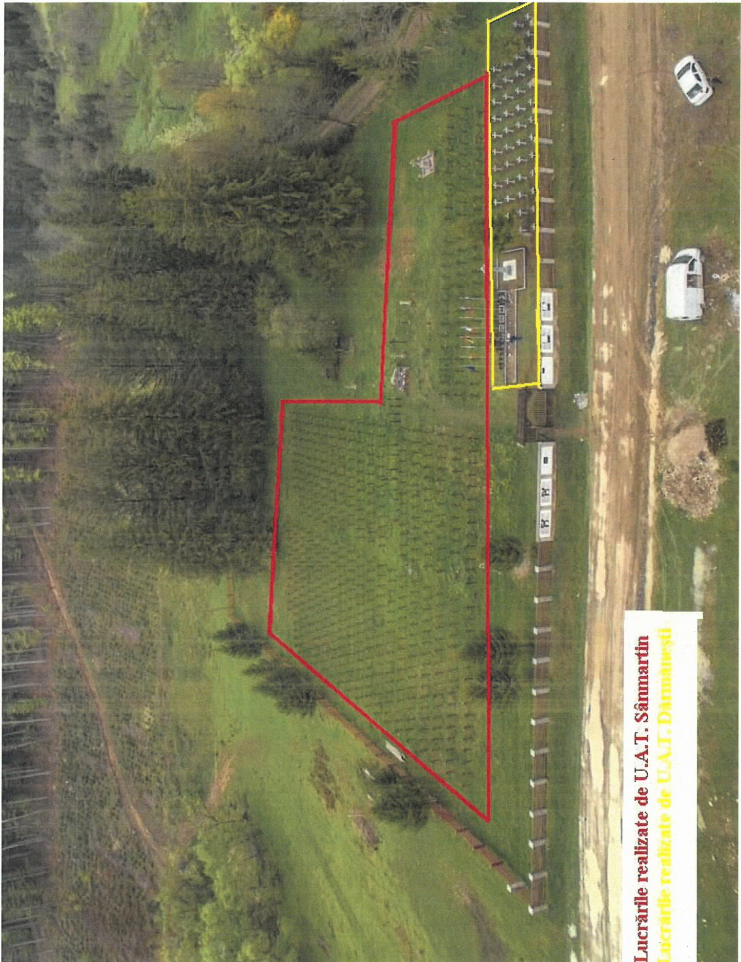
Lucrările realizate de U.A.T. Sânmartin Lucrările realizate de U.A.T. Dârmanești